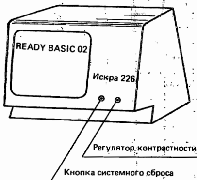
Рис. 2.1. Процессор микроЭВМ «Искра 226»

Клавиатура машины (рис. 2.2) позволяет вводить программы и данные, а также управлять работой машины. Для удобства пользования большая часть слов Бейсика может вводиться не только по буквам, но и целым словом одним нажатием клавиш.